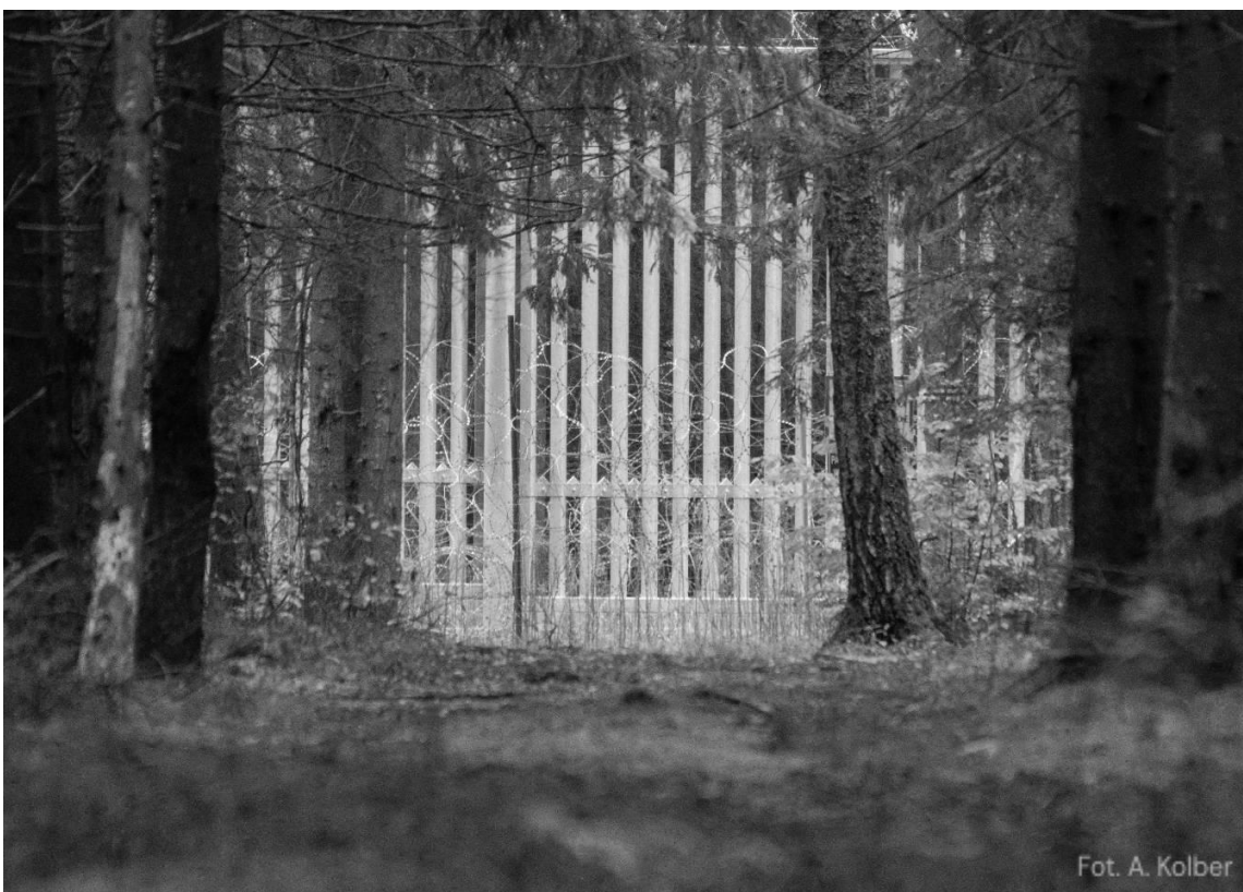
Fot. 1. Poziome wzmocnienie zamontowane w celu zapobiegania rozginaniu żerdzi podnośnikami samochodowymi.

Październik 2024 roku to okres prac nad zwiększeniem szczelności zapory fizycznej na granicy. Zgodnie z zapowiedziami składanymi przez przedstawicieli rządu jeszcze w marcu 1 , pionowe żerdzie płotu zostały wzmocnione o poziome elementy mające zapobiegać rozginaniu żerdzi lewarkami samochodowymi. Tego typu działania zostały zidentyfikowane przez rząd jako istotne w kontekście przekraczania granicy przez ludzi od czasu postawienia zapory 2 . Jednocześnie ani wrześnieowe przedłużenie obowiązywania strefy buforowej na granicy 3 , ani wspomniane wzmocnienie zapory nie przełożyło się znacząco na spadek ruchu na pograniczu. Piszemy o tym niżej, przy omawianiu demografii i trendów w omawianym miesiącu.