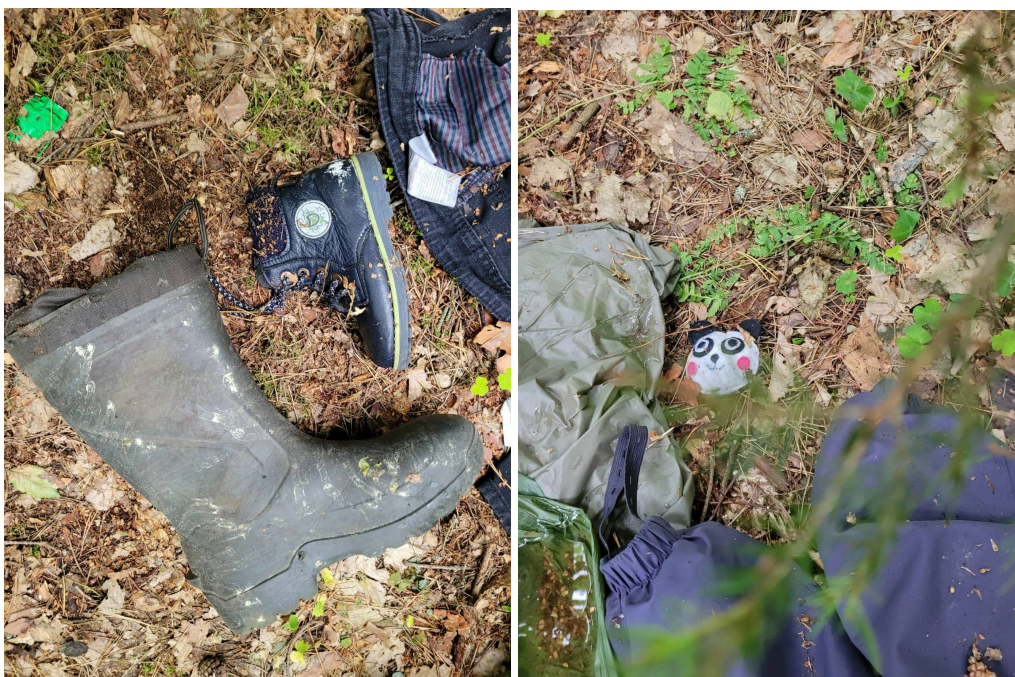
Rzeczy w obozowisku.

W raportowanym okresie otrzymaliśmy informację o 58 grupach składających się z 283 osób w drodze, co jest dość znacznym spadkiem w stosunku do poprzednich tygodni. Wśród nich było siedmioro małych dzieci, w tym pięcioro – małych dzieci bez opieki. W grupach proszących o pomoc była m.in. rodzina z dziećmi w wieku 3 i 10 lat oraz kobieta w zaawansowanej ciąży – obie te grupy znajdowały się w pasie pomiędzy umocnieniami polskimi i białoruskimi, zatem nie było możliwości udzielenia im pomocy. Otrzymaliśmy także zgłoszenie od pięcioosobowej rodziny przebywającej na terenie Łotwy. Najwięcej zgłaszających się osób pochodziło z Syrii, Etiopii, Afganistanu, Jemenu, Somalii i Erytrei. Kraju pochodzenia 19 osób nie udało się ustalić.